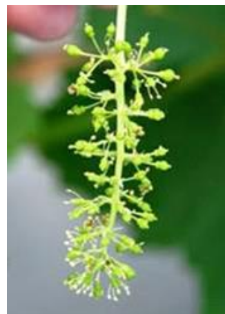
満開時のシャインマスカットの花穂

満開3～5日後（落花期）に、フルメット10ppmを加用したジベレリン25ppm溶液に花房浸漬する。