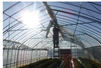
片付け（ビニールの撤去）