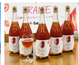
夏秋いちごワイン