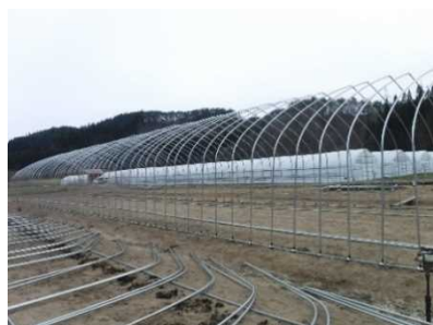
組立途中のハウス

収穫・調製作業は11月下旬まで続き、12月には片付け作業を行いワンシーズンが終了します。