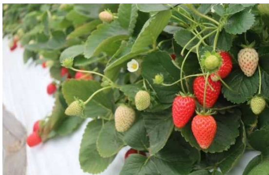
収穫期を迎えた夏秋いちご