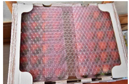
箱詰めされた夏秋いちご