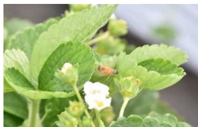
ミツバチによる受粉