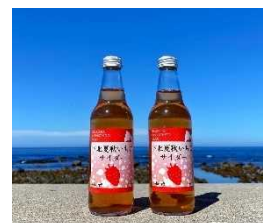
夏秋いちごサイダー