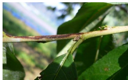
せん孔細菌病夏型枝病斑