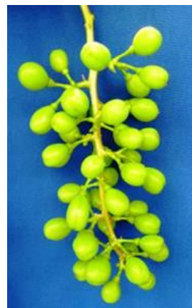
シャインマスカットの摘粒前後の果房 (左：摘粒前、右：摘粒後)