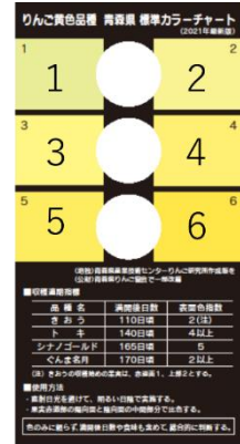
▲標準カラーチャート