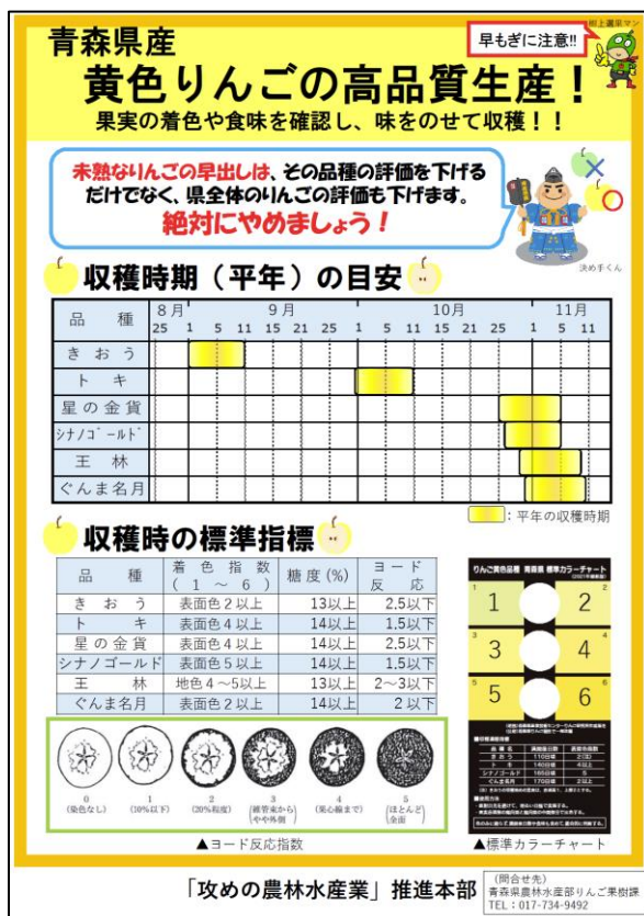
▲黄色りんごの適期収穫啓発チラシ