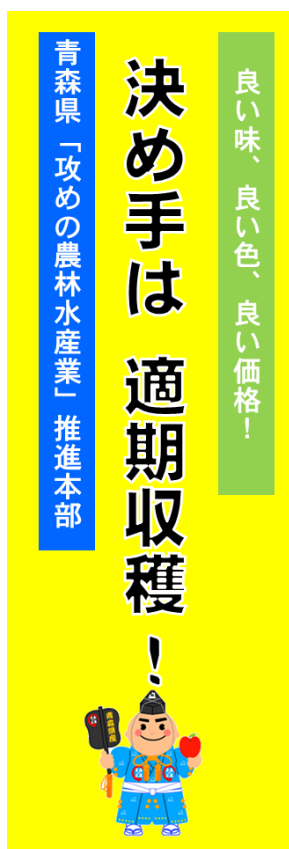
▲令和5年産青森りんご 適期収穫推進ノボリ

連絡先：りんご果樹課生産振興グループ 電話番号：017-722-1111代表 内線 5094、5092 017-734-9492直通