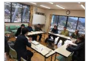
専門家の派遣・指導