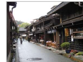
古民家等を活用した滞在施設の整備