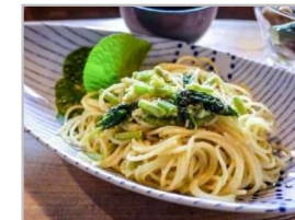
地元食材・景観等を活用した観光コンテンツの開発