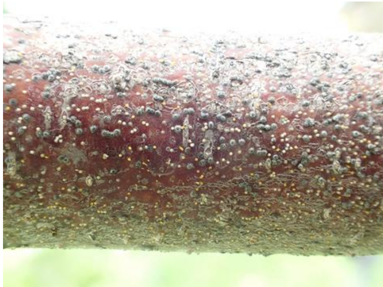
ナシマルカイガラムシ歩行幼虫（黄色い点）

今後、平年並みの気温で推移すると仮定した場合、本年のナシマルカイガラムシ第1世代歩行幼虫の発生始めは6月20日頃となる見込みである。例年発生が多い園地では「6月中旬」の薬剤散布にコルト顆粒水和剤3,000倍を使用する。散布むらが生じないように十分量を丁寧に散布する。散布後は、定着した歩行幼虫の発育や果実被害の発生を観察し、自園地における効果を確認する。