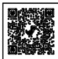
バッチレート による治療