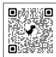
泥巻き法による 治療