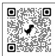
バッチレートによ る治療