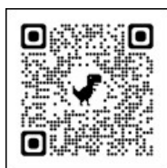
トップジンM オイルペーストに よる治療